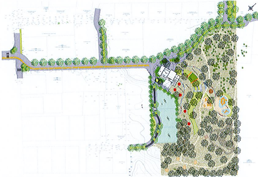
Plan de masse du projet

Accusé de réception en préfecture le 28/10/2019 à 10h06 DE Date de télétransmission : 28/10/2019 Date de réception en préfecture : 28/10/2019